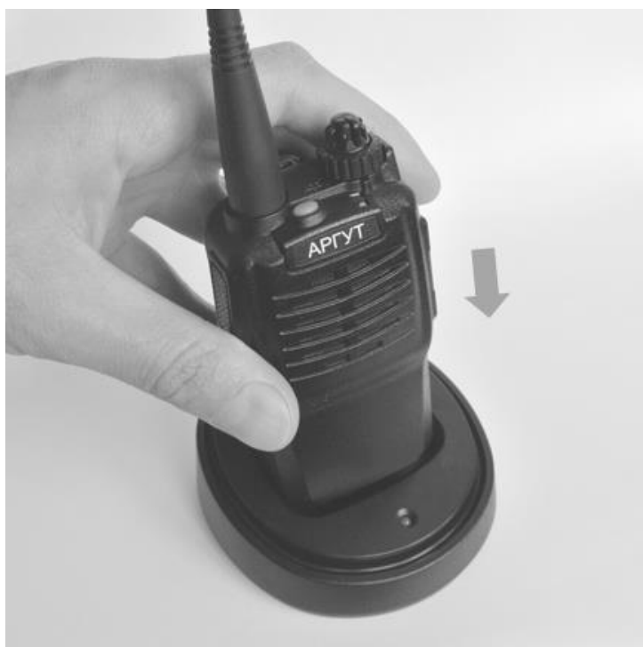
Рис. 6. Установка радиостанции на зарядную базу.

Установите радиостанцию с присоединённым аккумулятором на зарядную базу. Светодиодный индикатор на зарядной базе загорится красным. По окончании зарядки индикатор сменит цвет на зелёный — снимите радиостанцию с зарядной базы.