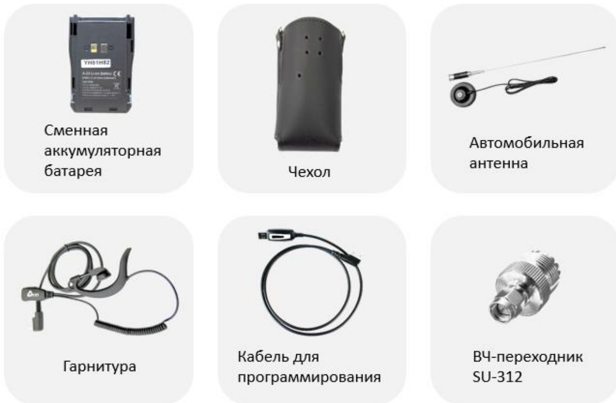
Рис. 10. Рекомендуемые аксессуары.

Рекомендуемые аксессуары Аргут к радиостанции представлены на рисунке 10.