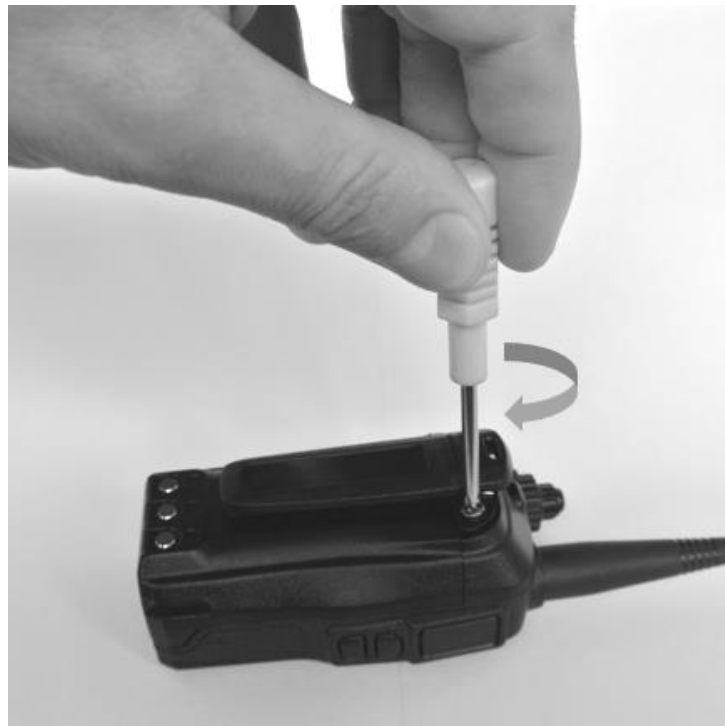
Рис. 5. Присоединение клипсы для крепления.

Если вы планируете носить радиостанцию на пояском ремне или крепить к одежде, присоедините к задней панели клипсу. Совместите крепёжные отверстия клипсы с отверстиями на задней панели и закрепите клипсу с помощью двух винтов из комплекта. Используйте крестовую отвёртку №3.