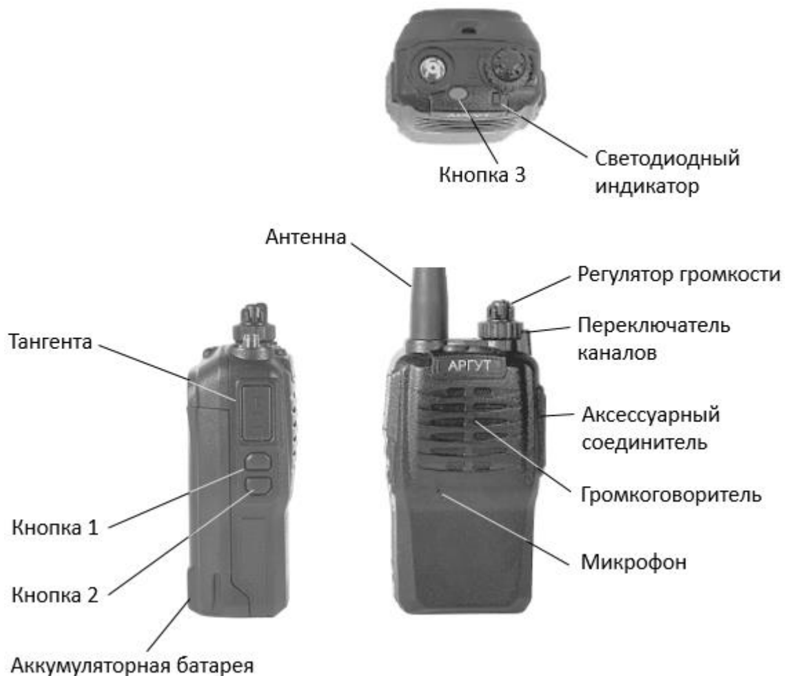
Рис. 1. Расположение органов управления, индикации и соединителей.

Радиостанция выполнена на металлическом шасси, в корпусе из ударопрочного пластика. Органы управления и индикации расположены на верхней и левой панелях корпуса. Соединитель антенны — на верхней панели. Соединитель подключения гарнитуры и кабеля программирования (аксессуарный соединитель) — на правой панели. Клеммы для присоединения к зарядной базе — на задней стенке аккумуляторной батареи.