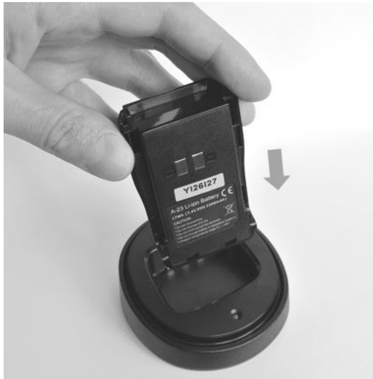
Рис. 7. Установка аккумуляторной батареи на зарядную базу.