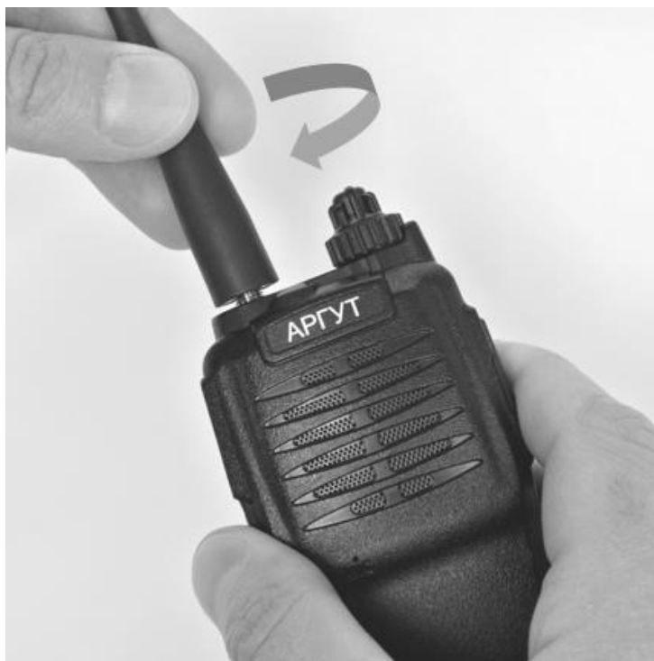
Рис. 4. Присоединение антенны.

Совместите резьбовой соединитель антенны с ВЧ-соединителем на верхней панели радиостанции. Вращая антенну по часовой стрелке закрутите соединитель до упора. Не прилагайте чрезмерных усилий при затяжке.