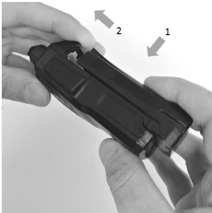
Рис. 2. Установка аккумуляторной батареи.

Совместите направляющие на аккумуляторной батарее с направляющими на шасси приёмопередатчика. Прижмите батарею к шасси и сдвиньте влево до щелчка.