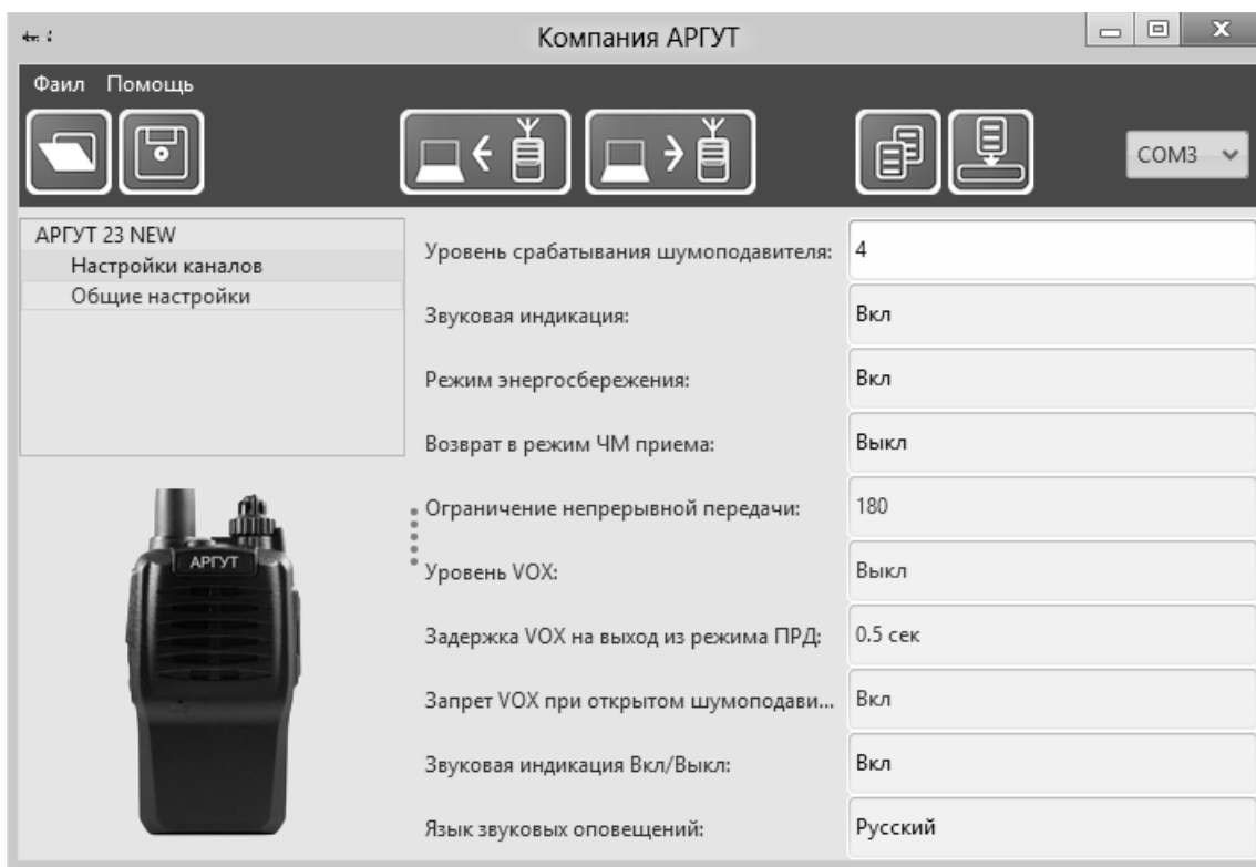
Рис. 9. Окно ПО настройки радиостанции.

Подключите радиостанцию к ПК с помощью кабеля для программирования. Кабель для программирования подключается к аксессуарному соединителю радиостанции (см. рисунок 8), а другим концом — к USB-порту ПК. Запустите ПО и выберите модель радиостанции «Аргут 23NEW». Включите радиостанцию. Светодиодный индикатор будет мигать зелёным раз в пять секунд. Нажмите программную кнопку «Прочитать из станции» в верхней части окна ПО. Светодиодный индикатор радиостанции будет часто мигать зелёным, в окне настроек появятся текущие установки параметров радиостанции.