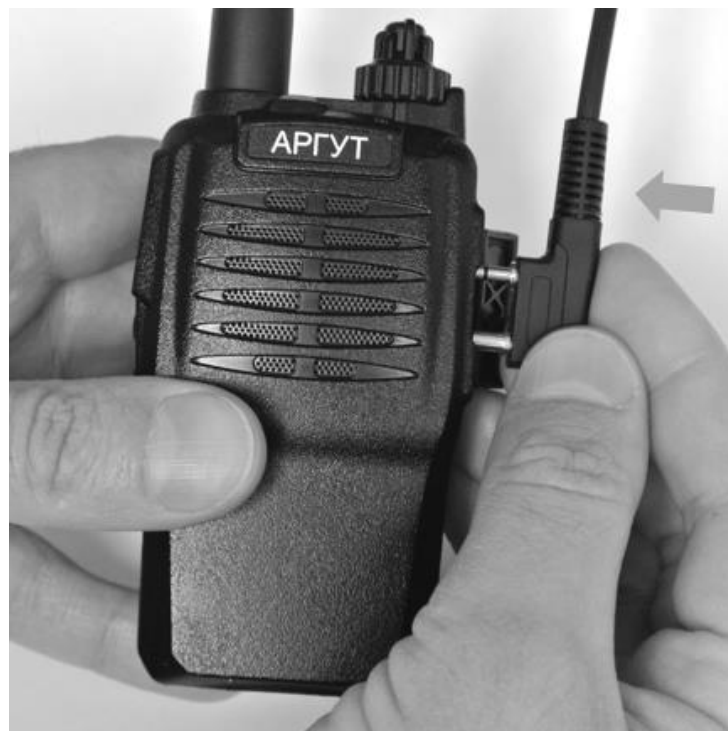
Рис. 8. Подключение гарнитуры.

Если вы приобрели гарнитуру и планируете её использовать, подключите её к радиостанции. Для этого отведите в сторону защитную крышку и подключите гарнитуру к аксессуарному соединителю.